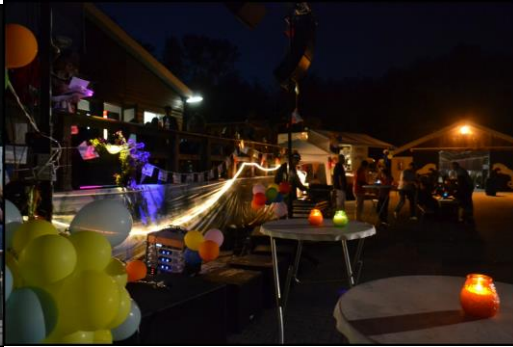
Feestavond met DJ